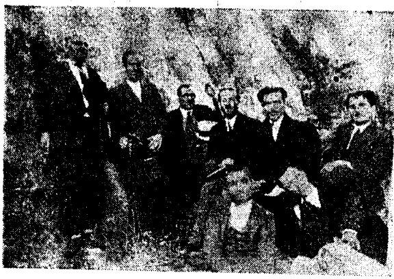
ΣΤΟ ΚΑΣΤΡΟ ΤΟΥ ΓΕΡΑΚΙΟΥ, ΠΡΙΝ ΑΠΟ 30 ΧΡΟΝΙΑ...

—Απέθανε και εκηδεύθη εις Κεφάλαια ή Έλένη σύζυγος Παν. Φίλιππα.