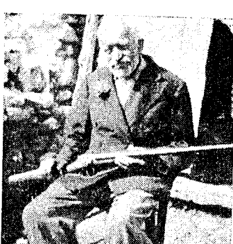
«Μεράκι μου ήταν πάντοτε τό κυνήγι. Αυτό τό νουφέρι είναι ό καλύτερος σύντροφός τής ζωής μου...»